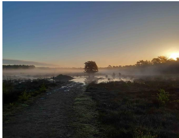
Aandacht voor het Vogelwandelboekje in de krant.