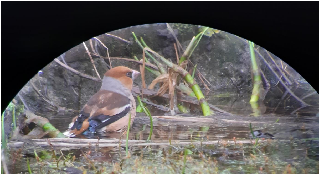
Appelvink tijdens tuintelling