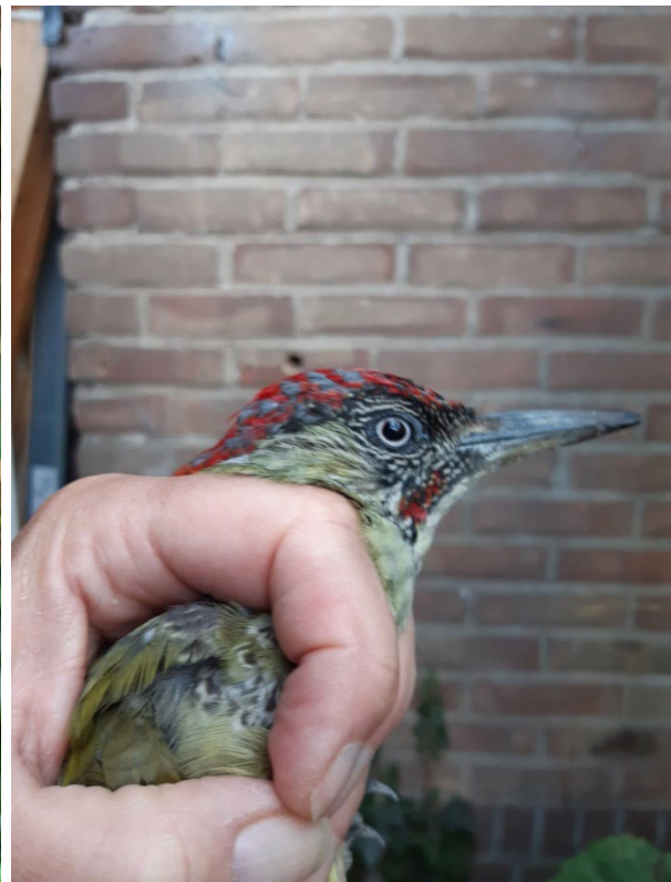
Op 13 september eindelijk een groene specht.