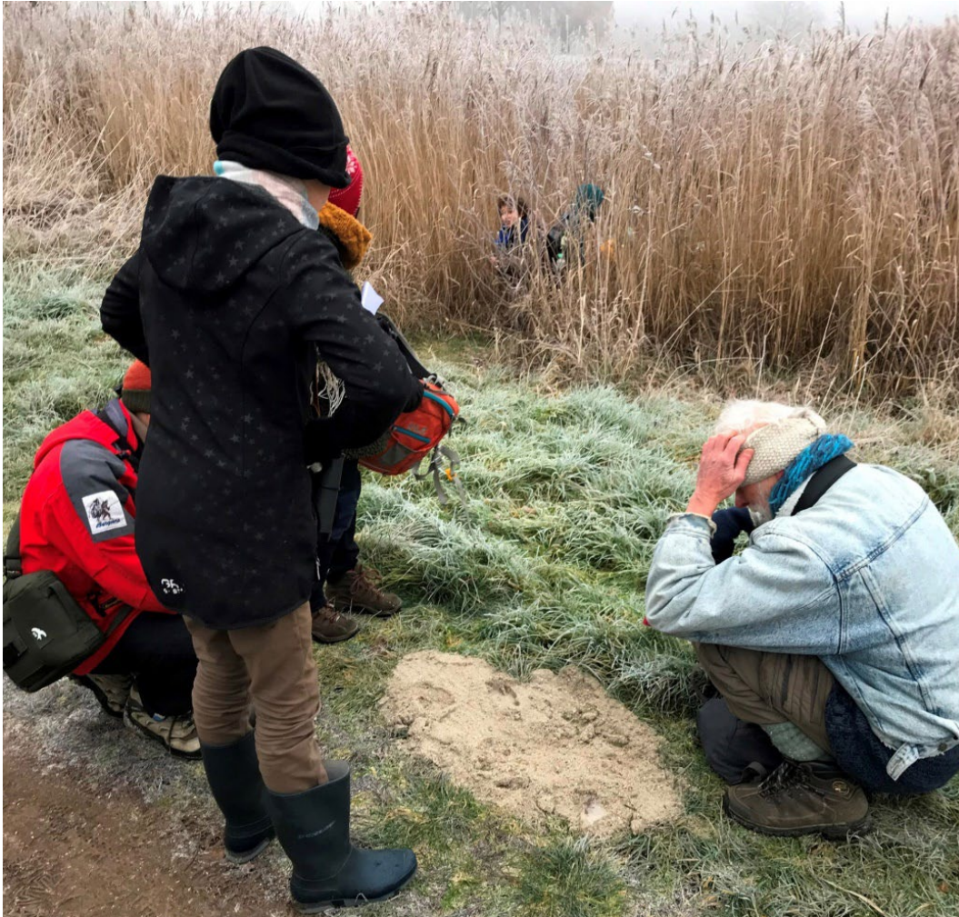
Sporen van een wolf?