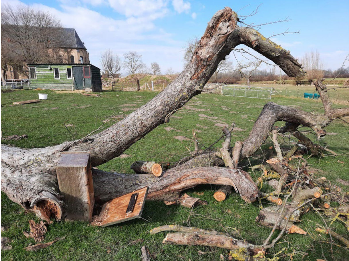
Omgevallen boom met nestkast in Voorst.

Volgens het KNMI was februari 2022 superzacht, kletsnat en erg windrijk. De regenval schijnt erg nadelig geweest te zijn voor de muizenstand. Ook de schaarste aan voedsel in het najaar en de winter van 2021-2022 schijnt op de lage muizenstand van invloed geweest te zijn. De uilen die vroeg broedden hebben de gevolgen van de lage muizenstand het sterkst ondervonden. In de tweede helft van het broedseizoen heeft de muizenstand zich enigszins hersteld en hadden uilen en torenvalken meer succes om jongen groot te brengen.