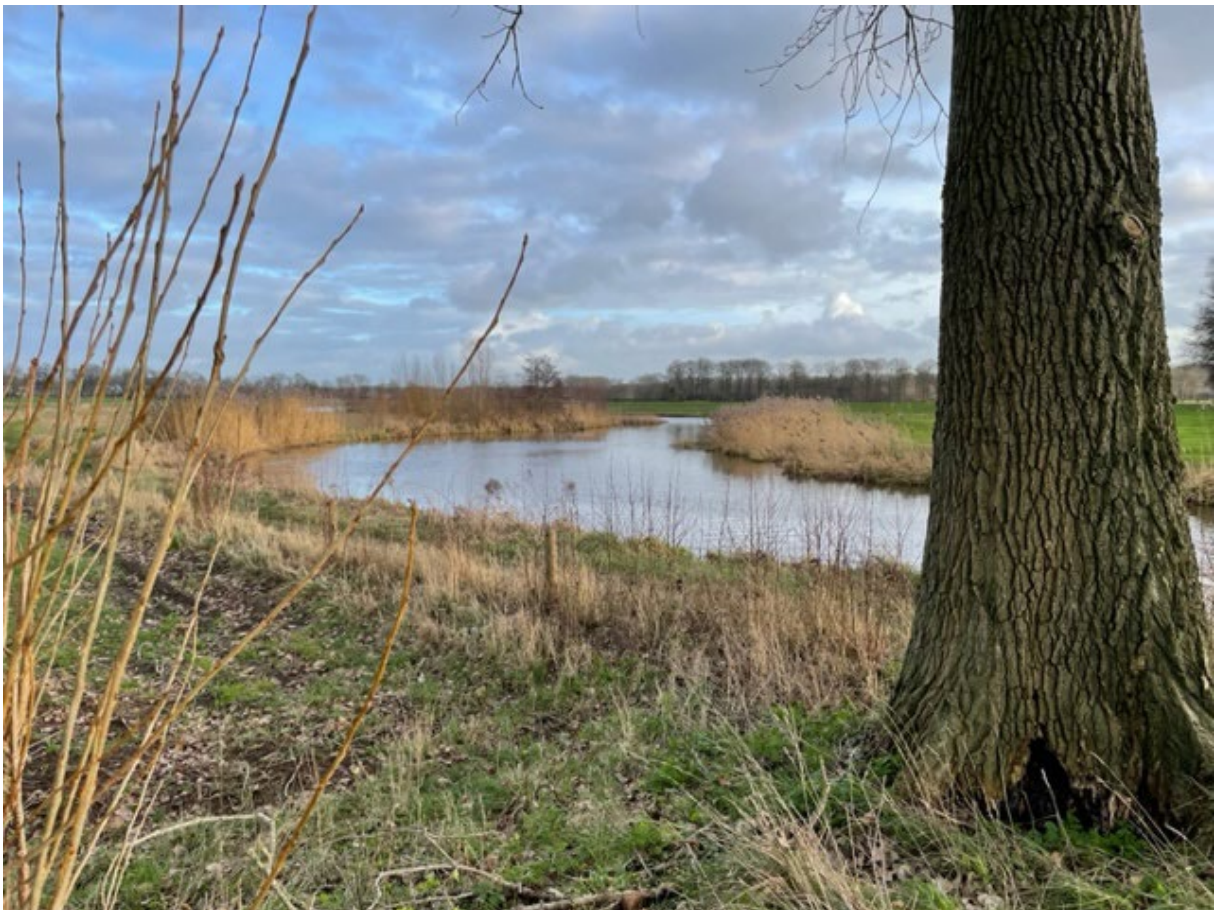
Berkelmeander, nog zonder brug.

Wordt ongetwijfeld vervolgd. De VWG is namelijk van mening dat de provincie de grenzen van het GNN niet zomaar had mogen verleggen. Bovendien vraagt de VWG zich af of de brug wel mag worden aangelegd binnen de GO. Binnen een GO mogen namelijk alleen maar projecten doorgaan die per saldo leiden tot een versterking van de kernkwaliteiten en de ecologische samenhang. En daarvan is hier volstrekt geen sprake.