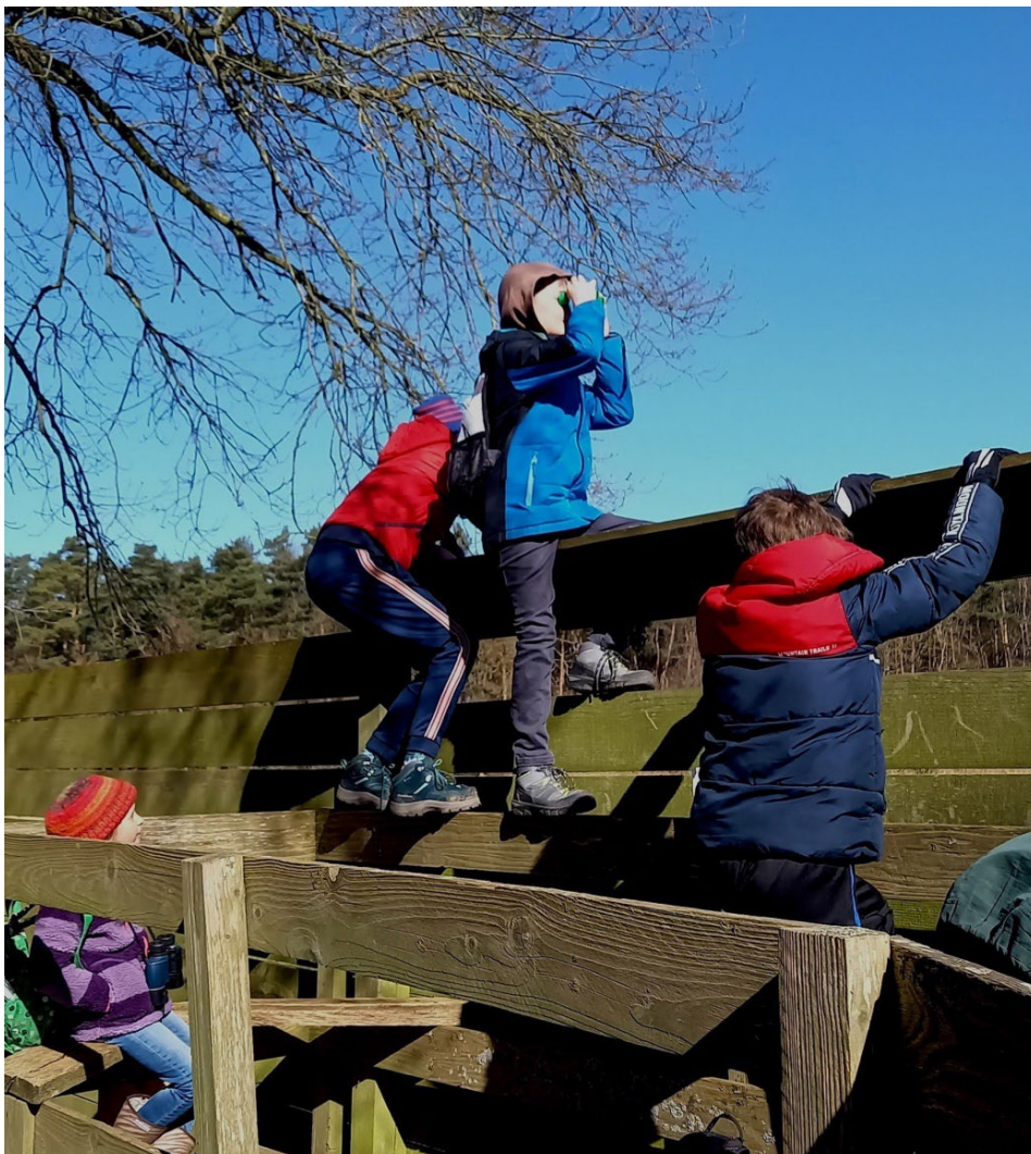
Als je hoog staat zie je meer.