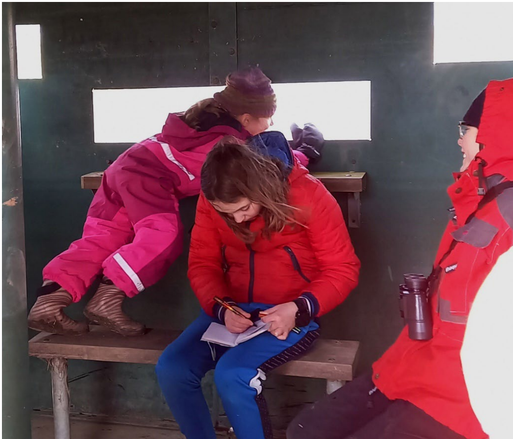
In de kijkhut in de Rammelwaard.