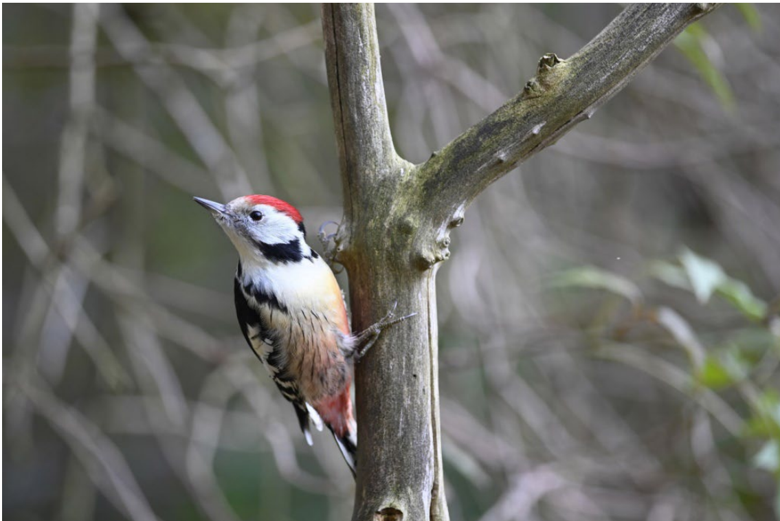
Middelst bonte specht