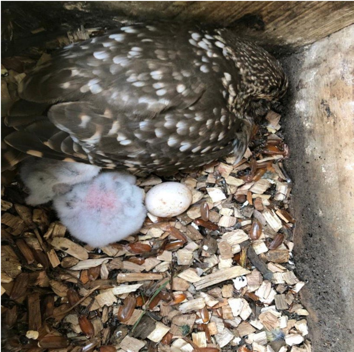
Van de drie eieren zijn er twee al uitgekomen.

Het broedresultaat van de steenuilen was mager, namelijk 79 jongen. In 2019, het laatste jaar voor corona heeft de UWG nog 116 jonge steenuilen uit zien vliegen. Niet alleen de muizenstand is debet geweest aan het magere broedresultaat. In meerdere kasten in de rayons werden bij de eerste controle eieren gevonden, die bij latere controles niet waren bebroed of verdwenen. Ook zijn er ondanks de genomen maatregelen tegen predatie dode jongen en dode volwassen vrouwtjes in nestkasten aangetroffen en waren de eieren verdwenen. In Vierakker heeft predatie van een steenuilvrouwtje buiten de nestkast plaatsgevonden. De drie jongen in de nestkast hebben we naar het Roofvogel Opvangcentrum Barchem gebracht.