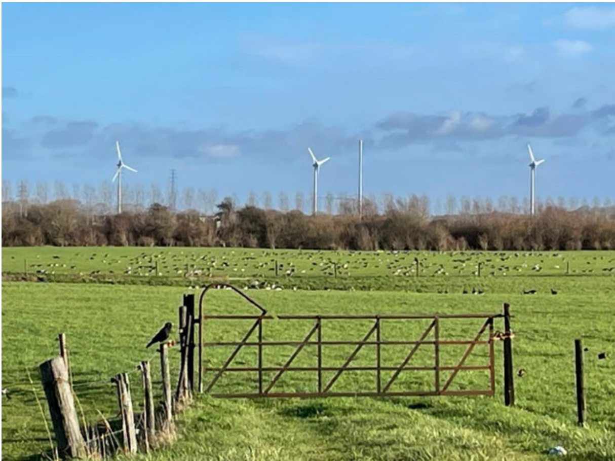
De Overmarsch is in beeld als locatie voor een zonnepark. De ganzen hebben het nakijken.

In het kader van de RES (Regionale Energie Strategie) is de gemeente Zutphen op zoek naar grote locaties voor zonnevelden. Hoewel Zutphen weinig landelijk gebied heeft zijn er twee grote zoeklocaties voorgesteld. De Overmarsch langs de N345 naar Empe en het Leestense Broek, waar eerder al het sportpark Meijerink is gekomen. Wij hebben in december een zienswijze ingediend tegen het ontwerp afwegingskader Zon op Land voor grote zonneparken. Op de Overmarsch foerageren kolganzen in de winter. Waar zonnepanelen liggen kan niet meer gevoerageerd worden. Het kleinschalige landschap van het Leestense Broek met nog altijd veel vogels zal verder worden aangetast. De gemeenteraad zal in maart 2023 een beslissing nemen.