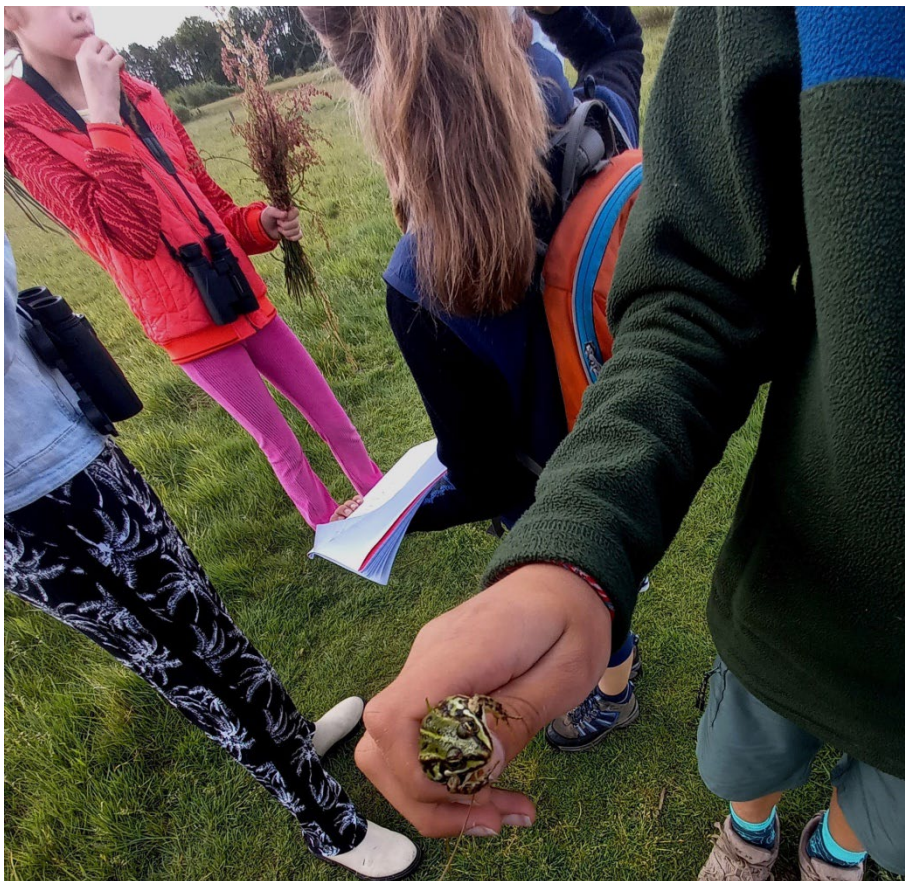
De groene kikker.