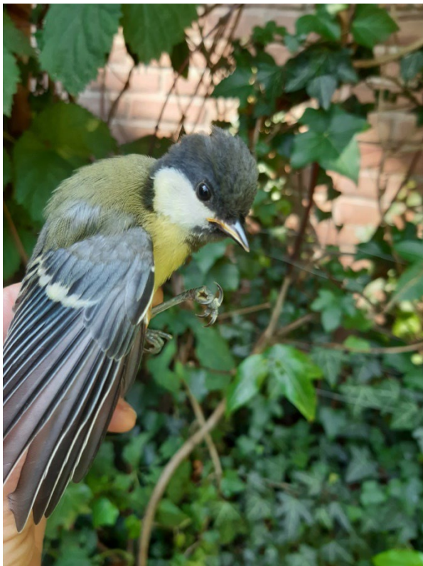
40% van de teruggevangen vogels was een koolmees

Zoals elk jaar heb ik voornamelijk kool- en pimpelmezen gevangen. Van de 298 nieuw gevangen vogels was 40% koolmees en 30% pimpelmees. De terugvangsten waren allemaal 'eigen' vogels, en ik kreeg ook geen terugmeldingen van in mijn tuin geringde vogels die elders waren teruggevangen of gevonden. De oudste vogel (voor zover bekend) was pimpelmees BG40396, geringd als 1kj-vogel op 30 november 2017. Dus in 2017 uit het ei gekropen en nu vijf jaar oud. Er vloog in 2022 ook nog een pimpelmees uit 2018 in het net, en een merel uit 2019. Leukste vangst van 2022: eindelijk een groene specht!