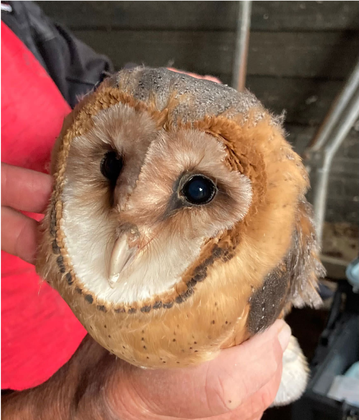
Kerkuil, slechts twee broedsels in 2022.

Ook het aantal jongen van kerkuilen in 2022 is laag namelijk vijf. In 2019 zijn er in de rayons nog 40 jongen uitgevlogen. In hoeverre de muizenstand dan wel andere oorzaken debet zijn aan het lage aantal jongen is onduidelijk.