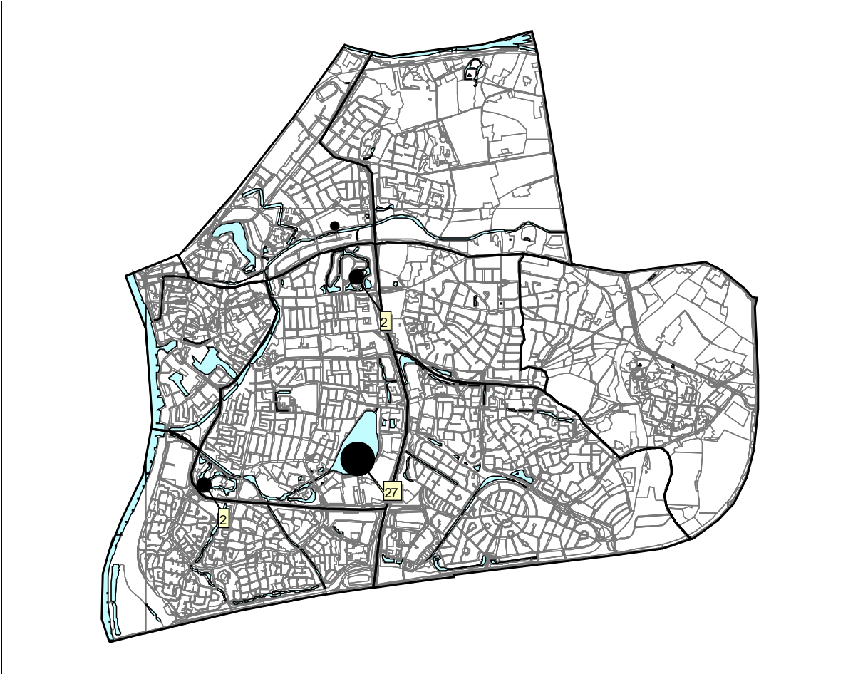
Zutphen 2008; Grauwe Gans 32 territoria