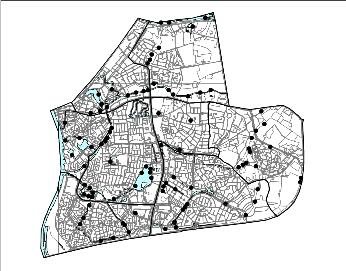
Zutphen 2008; Wilde eend 91 territoria