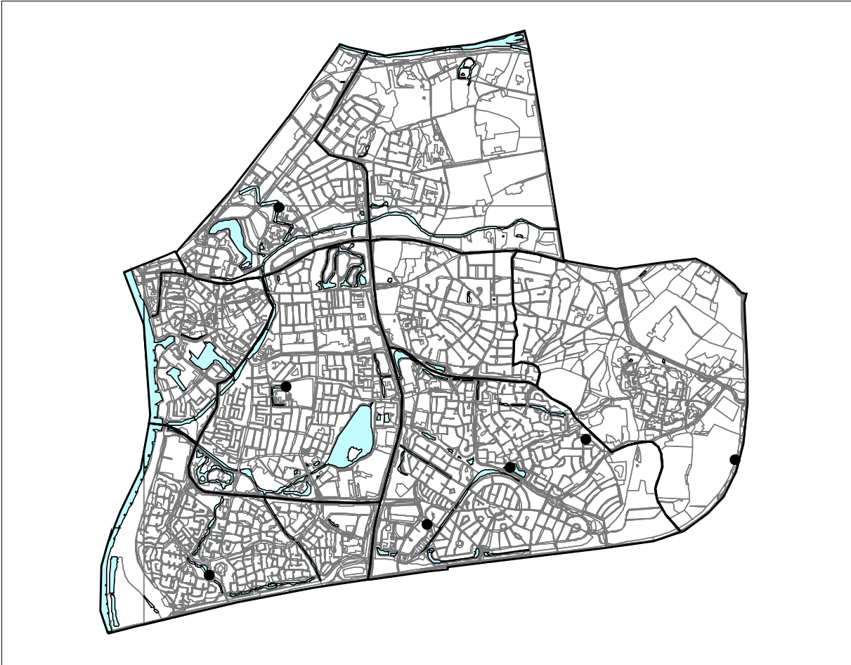
Zutphen 2008; Knobbelzwaan 7 territoria