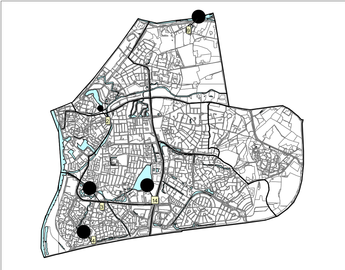
Zutphen 2008; Soepgans 32 exemplaren