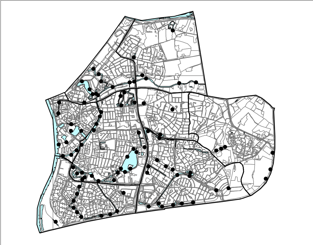
Zutphen 2008; 92 territoria